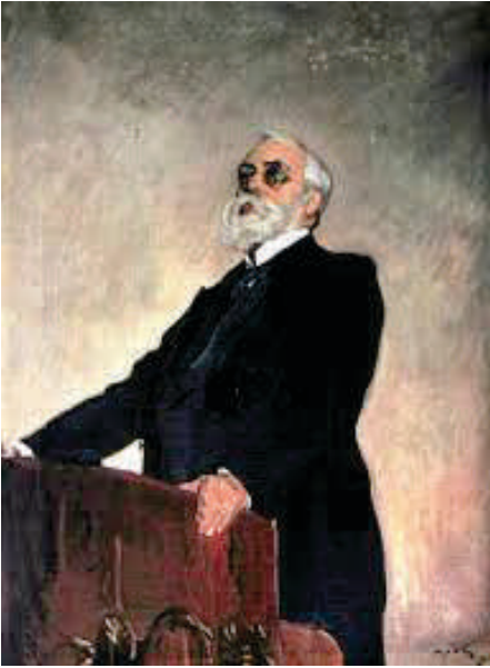
Сергей Андреевич Муромцев.