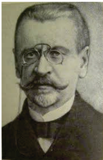
Лев Иосифович Петражицкий.