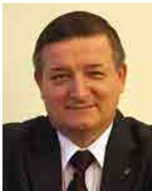
В.С. КАМЕНКОВ, д.ю.н., зав. кафедрой Белорусского государственного университета, зам. председателя общественного объединения «Белорусский республиканский союз юристов», член президиума Спортивного третейского суда, заслуженный юрист Республики Беларусь