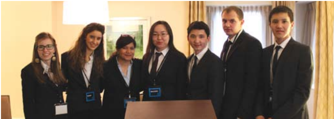
Команда КазГЮУ с командой Universidad Autonoma de Madrid (Испания)

должен быть смещен с исключительно теоретического к освоению учебного материала с разрешением конкретных сложных практических ситуаций, возникающих в практике применения международного права.