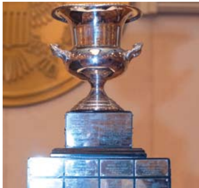
Кубок международных игровых судебных процессов им. Ф. Джессопа