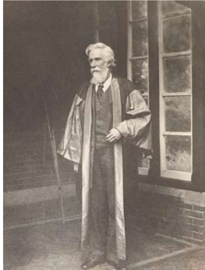
Альберт Венн Дайси (Albert Venn Dicey)

Исследуя европейскую политику, Дайси напоминал английским гражданам о том, что где есть дискреция, там есть простор для произвола 7 , и уровень свободы в республике из-за широких полномочий власти оказывается на таком же уровне, как и в монархии 8 . Он утверждал, что на протяжении XVIII в. многие государства на континенте были далеки от деспотических, но не было ни одной континентальной страны, где граждане были бы защищены от произвола власти 9 . При этом он приводил такой пример: «Когда Вольтер приехал в Англию, он сразу же четко почув-